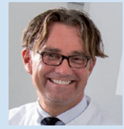
Pr Reto W. Kressig Bâle